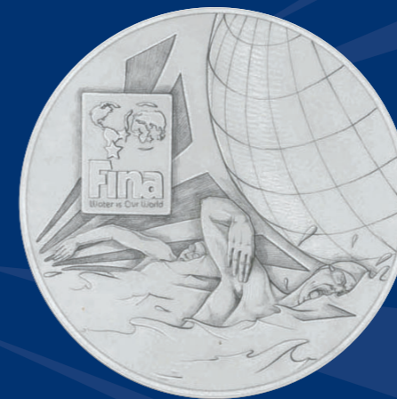
NUOTO IN ACQUE LIBERE